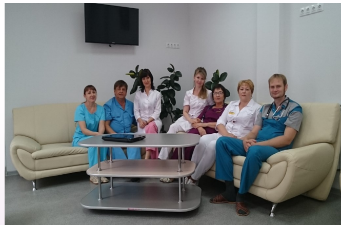
ГБУЗ «Михайловская городская детская больница»

Адрес: Волгоградская область, г. Михайловка, ул. Леваневского, д. 2