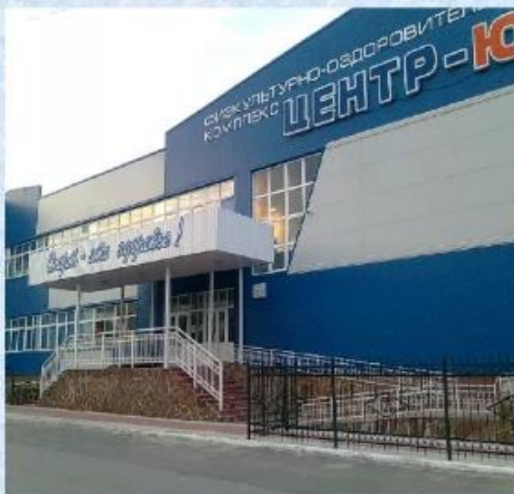
Физкультурно-оздоровительный комплекс «Центр-Юг»