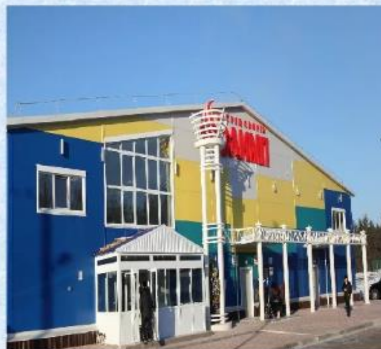
Ледовый дворец «Олимп»